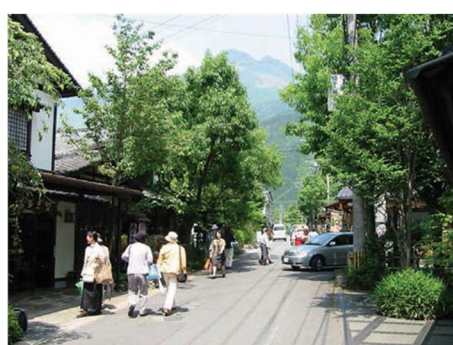
■ 湯布院散策（イメージ）

二階堂酒造有限会社が代々受け継ぎ、また、収集してきました美術品を広く一般に公開。二階堂美術館は、おもに近代の日本画を展観。