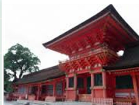
■ 宇佐神宮（イメージ）

温泉湧出量は全国トップクラスで、源泉の数は800本以上存在する。落ち着いた雰囲気温泉地として全国的に人気が高い。